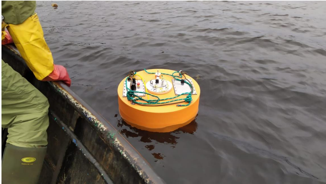
4.attēls Uzlabotā roņu atbaidīšanas ierīce “Ronis-2” ar maināmu akumulatoru (vidū).

Ja skaņu signāli izrādīsies “ūsainajiem draugiem” nepatīkami, paliek vēl viena problēma. Katras ierīces pašizmaksa varētu būt ap 5-6 tūkstošiem eiro (visdārgākā ierīces daļa ir skaļrunis). Pie tam šī ir pašizmaksa, bez tirdzniecības uzņēmumiem. Ir droši, ka šādām lietām būs pieejami Eiropas fondu atbalsta/līdzfinansējuma resursi. Kāds varētu būt līdzfinansējuma apjoms? Zinoši avoti vērtē, ka visticamāk tas varētu būt ap 80%. Piemēram, ja ierīces cena 6000 eiro, Eiropas nauda nosegtu 4800, pašam zvejniekam jāpiemaksā 1200. Nav maz, bet nav arī nesasniedzami daudz. Te jābūt pārliecībai, ka ierīce strādās ilgi un labi. Daļēji uz šo varēs atbildēt 2021.gada rudenī, kad beigsies “roņu skaļruņa” jaunās modifikācijas izmēģinājums.