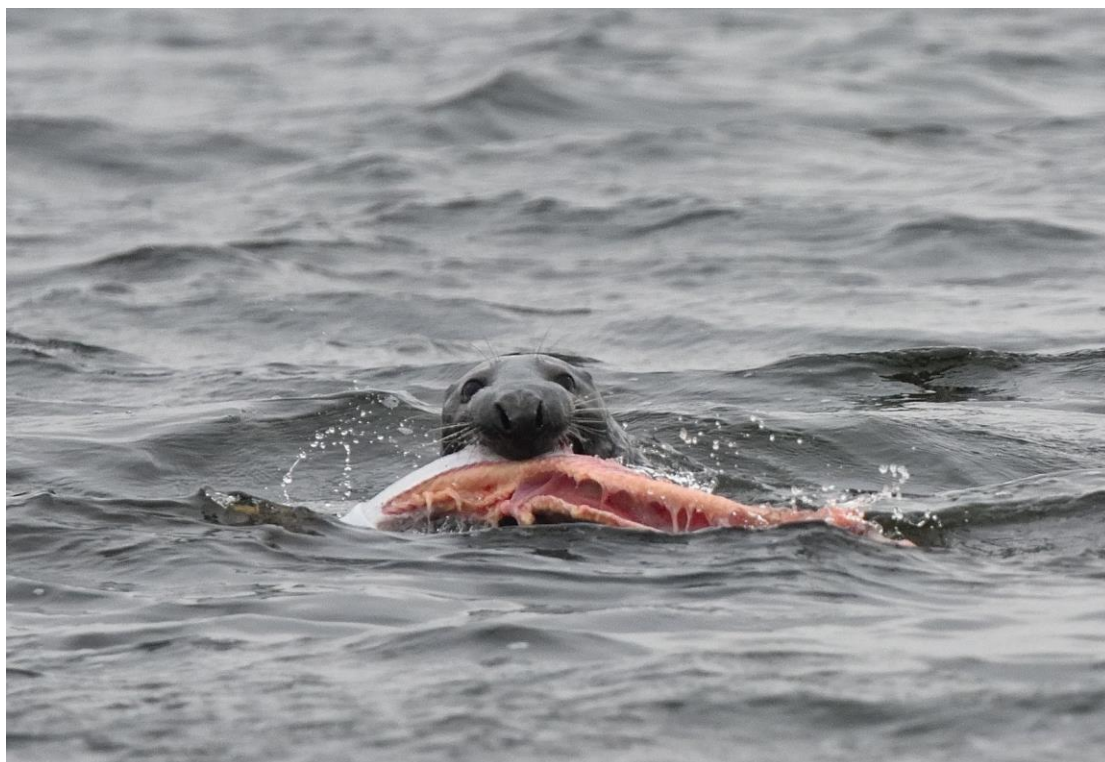
1. attēls. Pelēkais ronis ar noķertu lasi pie Mangaļsalas mola.

Vismaz astoņus pēdējos gadus nepārtrauktajām zvejnieku sūdzībām par roņu nedarbiem ir pietiekams pamats. To var konstatēt gan individuālās sarunās ar zvejniekiem gan oficiālos pētījumos.